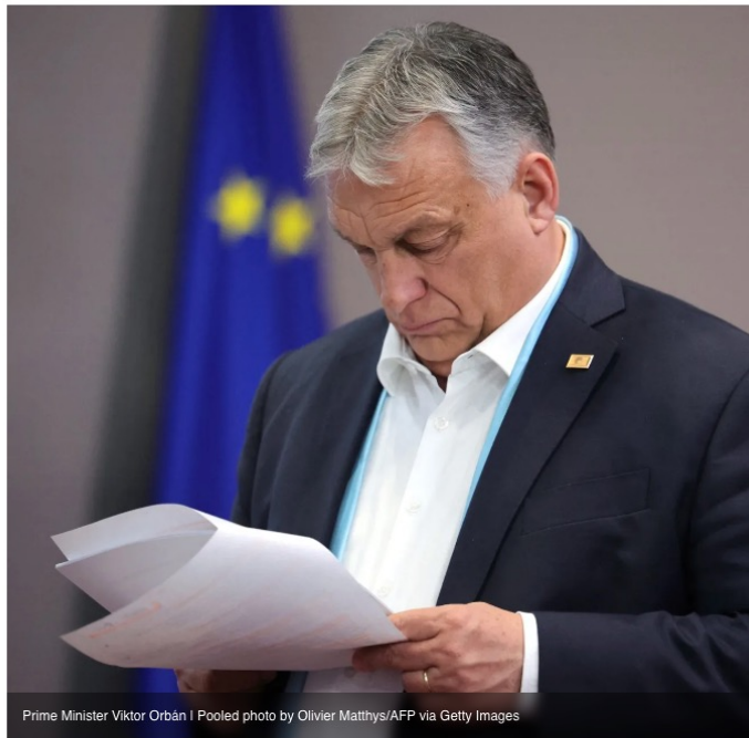
Prime Minister Viktor Orbán

If passed, Budapest could receive some €13.2 billion from Brussels.