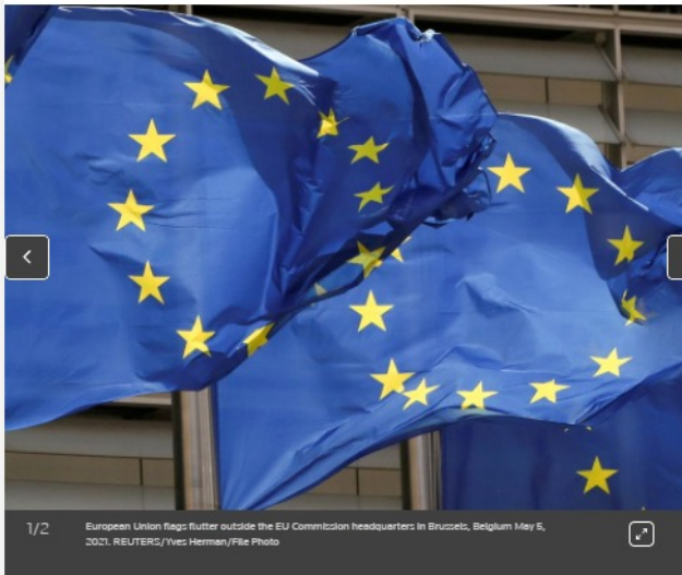
1/2 European Union flags flutter outside the EU Commission headquarters in Brussels, Belgium May 5, 2021.

WARSAW/BRUSSELS, Sept 7 (Reuters) — The European Commission said on Tuesday it had asked the EU's top court to fine Poland over the activities of a judges' disciplinary chamber, stepping up a long running dispute with Warsaw over the rule of law.