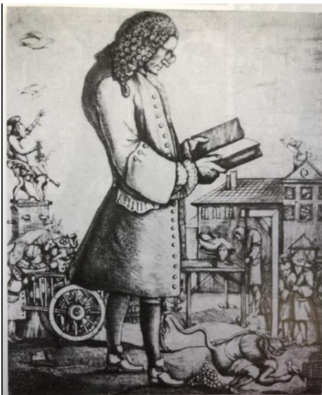
Pristranski sodnik s hudičevo podkupnino 17.st.

V zgodovini je bilo mesto in položaj sodnika vedno vezano s civilizacijskimi standardi, na katere je oblast še posebej pazila in jih varovala. To je izhajalo že iz 5. člena Hamurabijevega zakonika, ki pravi, da mora sodnik, ki je sodbo ponaredil, plačati kazen in odstopiti z mesta sodnika. 16 To je pomenilo, da sta bili pravičnost in resnica vrednoti sodniškega poklica, ki sta v pravnem prostoru prisotni že od nastanka prvih zapisov prava. Podobno je izhajalo iz Svetega pisma stare zaveze - judovske tradicije, kjer lahko beremo, da si