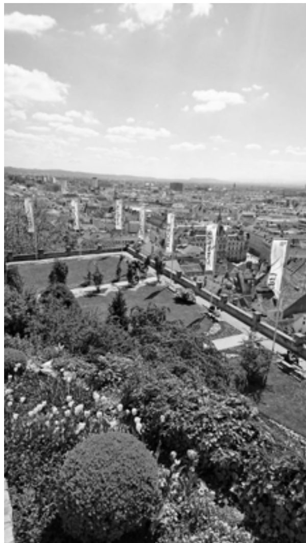
Pogled na Graz z griča Schlossberg.

Mesto Graz je res enkratno. Vzemite si kakšen dan časa, odpravite se čez mejo in ga dodobra raziščite.